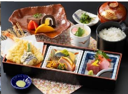
昼食 ※季節や仕入れにより内容の変更あり