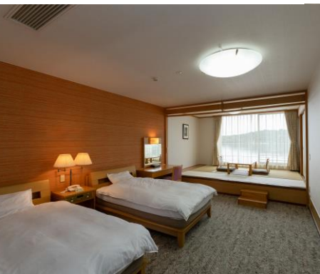
客室 ※部屋タイプが異なる場合があります。