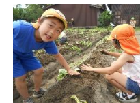
さつま芋苗植え 地域の方の畑に さつま芋の苗を 植えたよ！

土と遊び、水にたわむれる 全身でリズム運動をし、道草をしながら散歩や山登りを 楽しむ。 しっかり食べて、よく眠る 絵本の読み聞かせに目を凝らし、耳を澄ませる 大きな声で歌い、思う存分絵を描く・・・