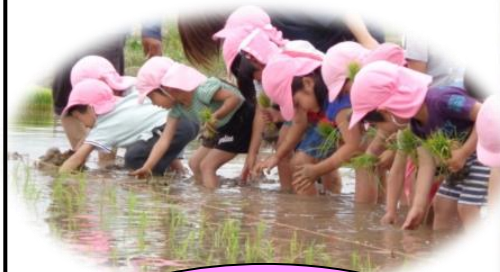
環境保育、地域を知る活動、世代間交流を通して様々な人とふれあい、人とかわる力を育てます。