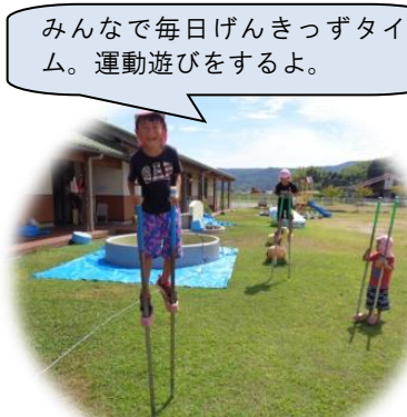
みんなで毎日げんきっずタイム。運動遊びをするよ。