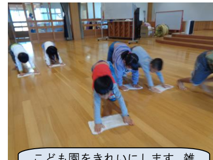
こども園をきれいにします。雑巾がけは頑張る力もつきます。