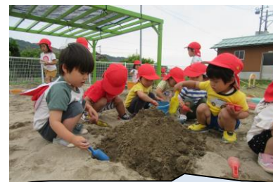
広い園庭の砂場や遊具、プールで友達と遊ぶよ。