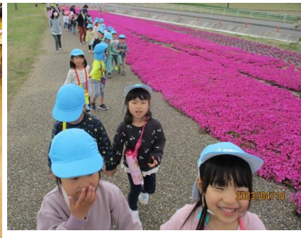
園外保育に出かけたよ。いろんな発見がいっぱい!!