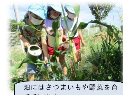
畑にはさつまいもや野菜を育てています。