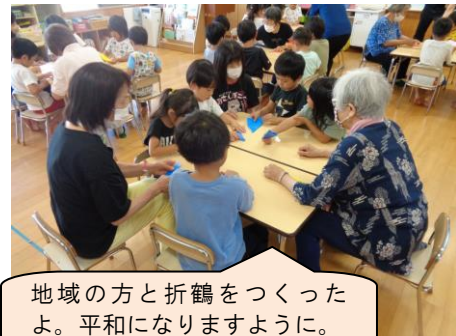
地域の方と折鶴をつくったよ。平和になりますように。