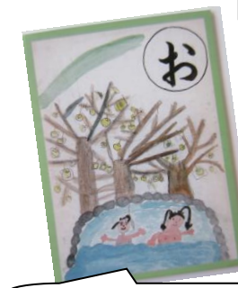
おだやか温泉の町梨の町