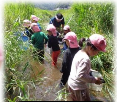
湯梨浜町は大切なふるさとです。