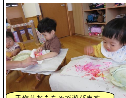
手作りおもちゃで遊びます。どの穴に入るかな?