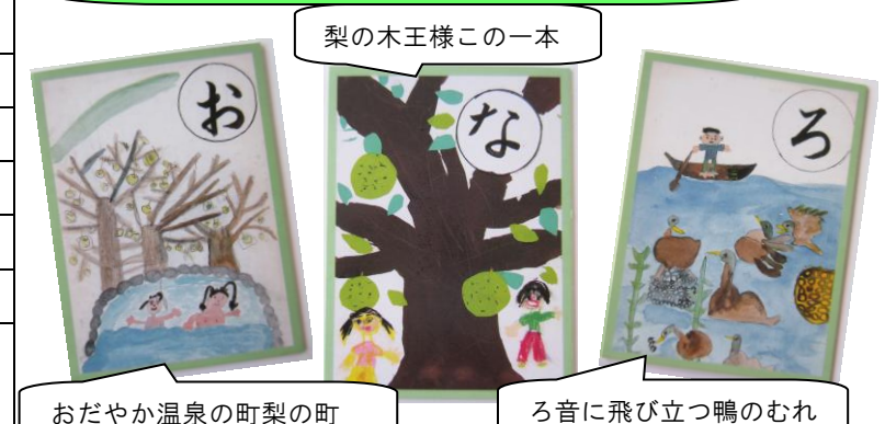
梨の木王様この一本