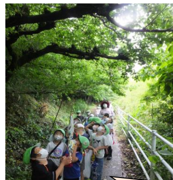
山へ出かけたよ。いろんな発見 がいっぱい!!