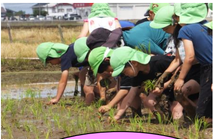
地域の方の協力で、 田植えや稲刈り体験