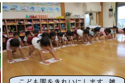
こども園をきれいにします。雑 巾がけは頑張る力もつきます。