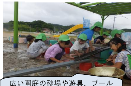
広い園庭の砂場や遊具、プール で友達と遊ぶよ。