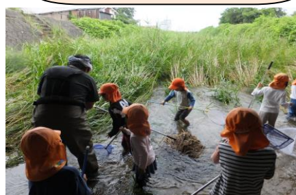
湯梨浜町は大切なふるさと です。

環境保育、地域を知る活動、 世代間交流を通して様々な 人とふれあい、人とかわる 力を育てます。