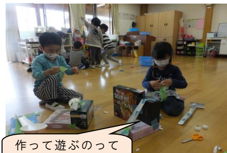
作って遊ぶのって おもしろいね。