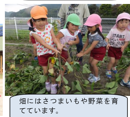
畑にはさつまいもや野菜を育 てています。