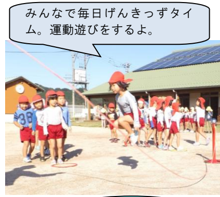
みんなで毎日げんきつづタイ ム。運動遊びをするよ。