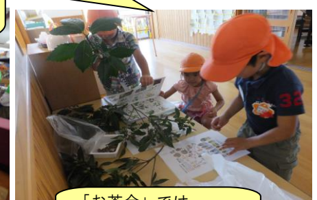
「お茶会」では お茶の心を学びます。