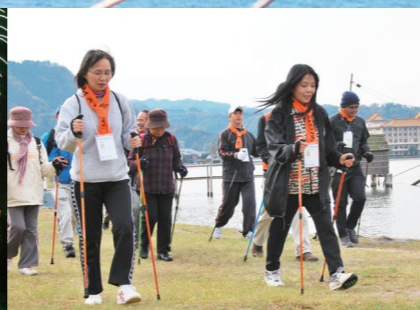
ノルディック・ウォーク