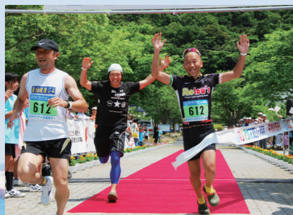
ホワイトトライアスロン in 湯梨浜