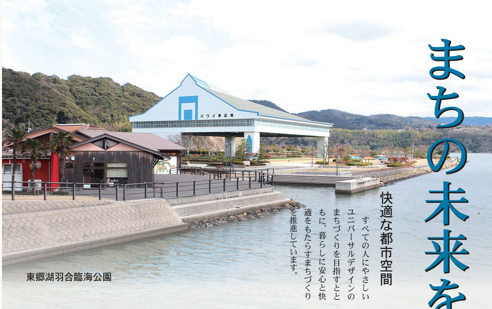
東郷湖羽合臨海公園