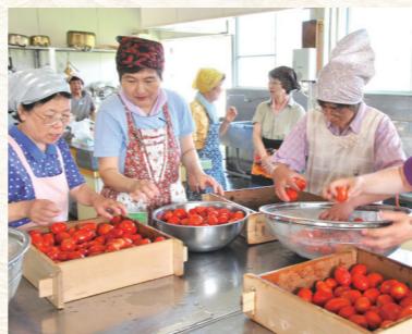
特産「湯梨浜の四季」作業中の様子