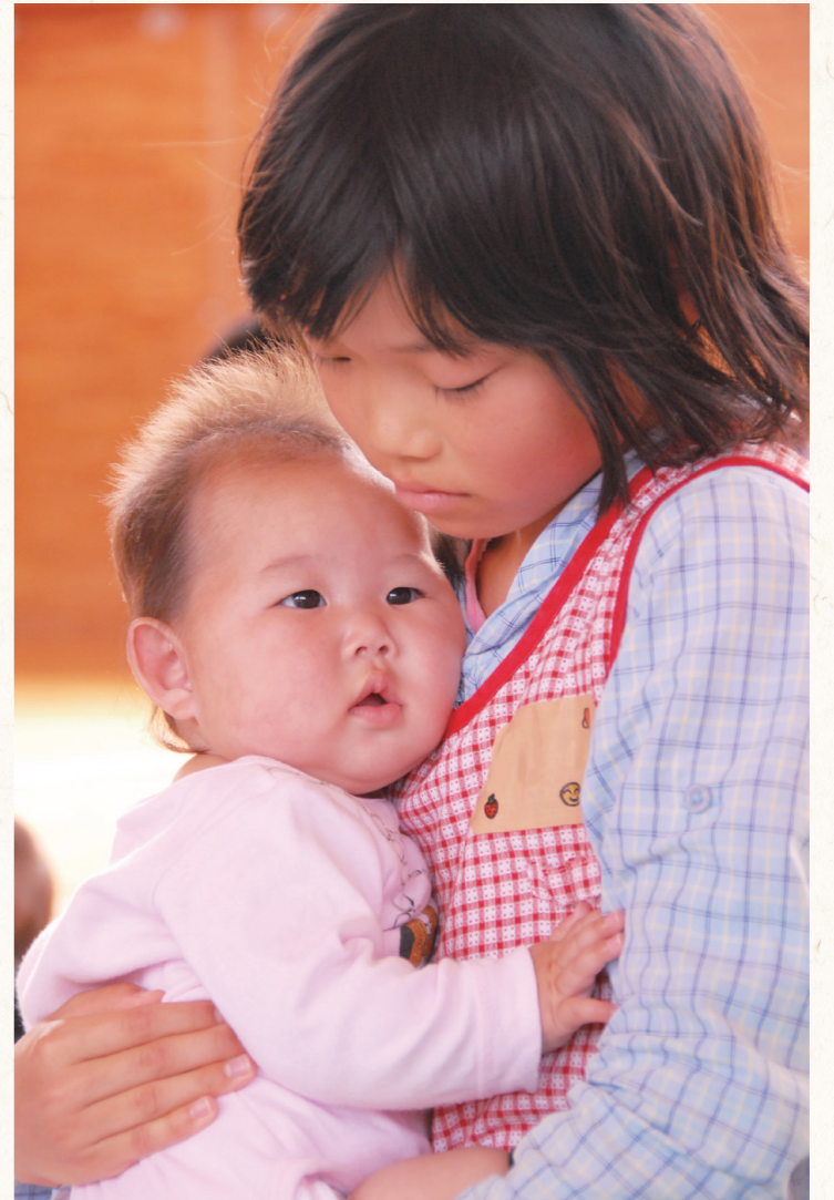
赤ちゃん登校日の様子

また、低保育料や保育時間の延長など、保護者のニーズに応じたサービスの提供およびその向上に努めています。そのほか、子育て支援センターの設置により、保護者が抱える悩みや不安の解消、保護者同士の交流を広げる取り組みも行っています。