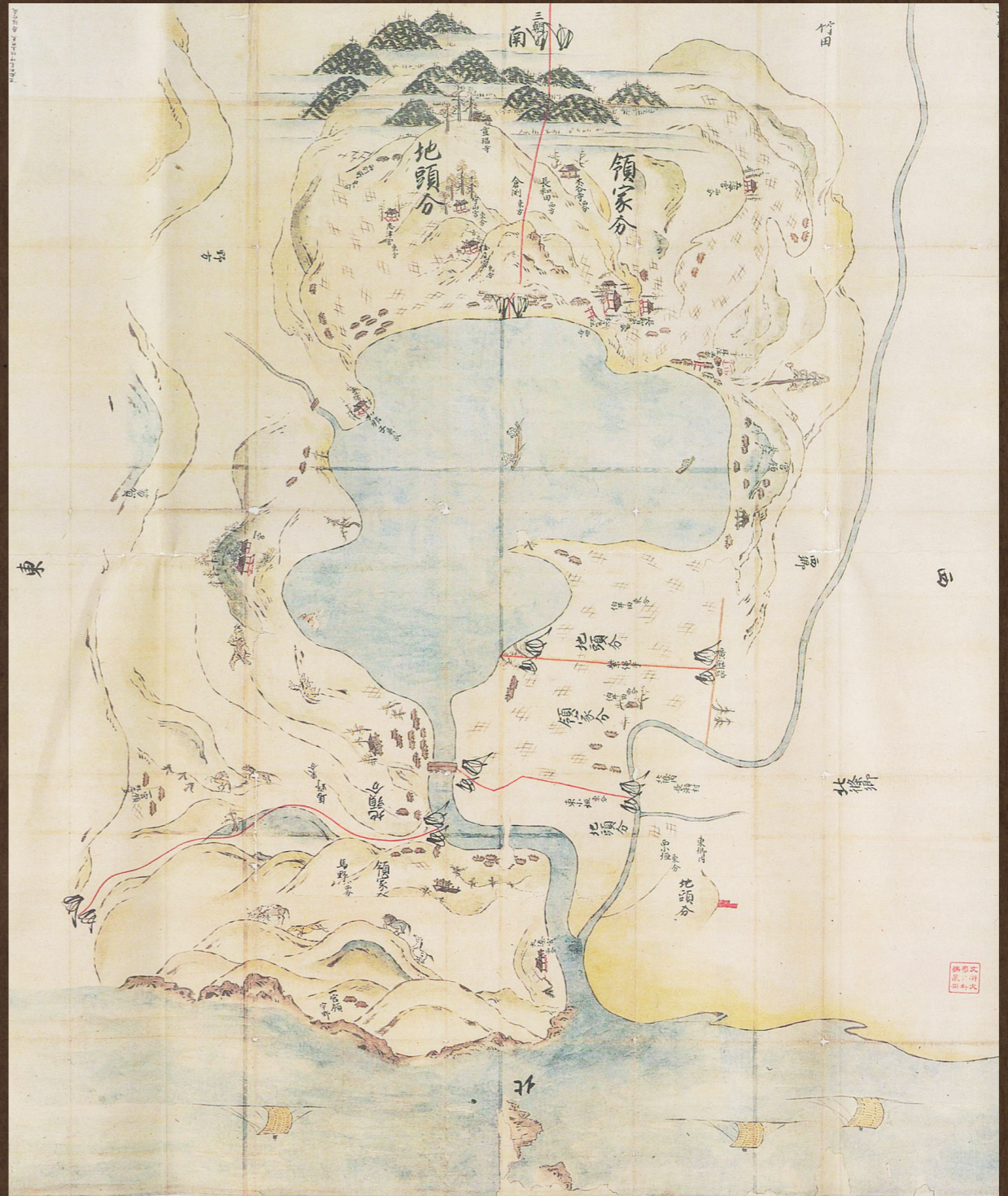
伯耆国河村郡東郷庄下地中分絵図（模写本） 東京大学史料編纂所蔵

弥生時代から中世にかけての巨大複合遺跡「長瀬高浜遺跡」から発見された円墳です。墳丘の中央にある石棺からは、ほぼ完全な形をした推定30歳前後の成年女性の遺骨と、副葬品の鉄刀が見つかりました。現在は、遺跡の南東側に移転復元されています。