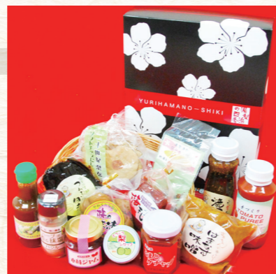
町特産加工品の詰め合わせ「湯梨浜の四季」

農林水産業をはじめ、観光業などの業種と連携しながら商品ブランドの育成を行い、湯梨浜ブランドの形成と定着を図っています。