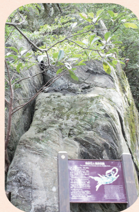
天女が羽衣を掛けたとされる大石

羽衣石山に降臨した天女が羽衣を脱いで水浴びをしていたところ、その様子を見ていた男が、羽衣を隠してしまいました。天女は仕方なくその男と結婚し、2人の子どもを授かります。しかしある日、天女はついに羽衣の在りかを探しだし、その羽衣を羽織ると、夫と子どもを残したまま天界へと去ってしまいました。