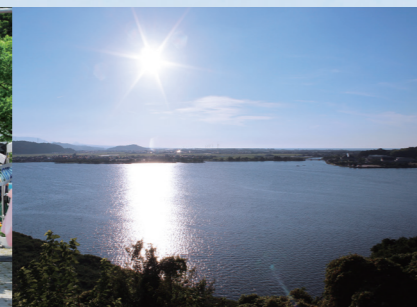
出雲山からの眺望