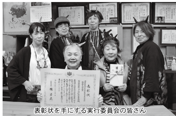
表彰状を手にする実行委員会の皆さん