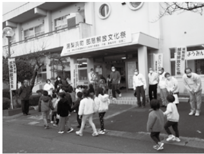
解放文化祭 2024 の様子

発表、東郷小学校人権教育推進部会や読み聞かせグループ「おはなしれつしゃ」による読み聞かせが行われます。また、毎年恒例の地元で古くから伝わる郷土料理「ボテ茶」の体験コーナーやフリーマーケットも行われます。