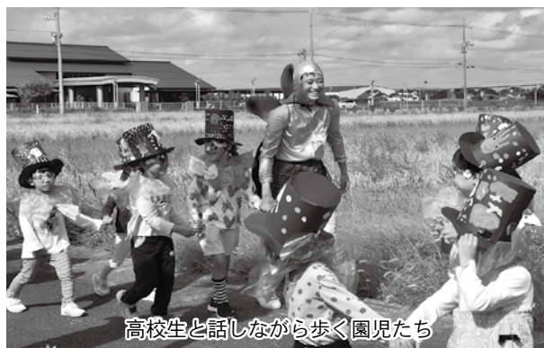
高校生と話しながら歩く園児たち