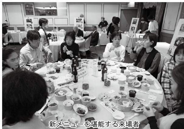
新メニューを堪能する来場者