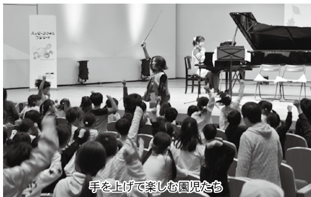
手を上げて楽しむ園児たち

会場はアンコールの声が上がるほどの盛り上がりで、園児たちは音楽に合わせて体を動かしたり、一緒に歌ったりして楽しんでいました。