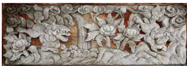
山門扉の唐獅子と牡丹の彫刻