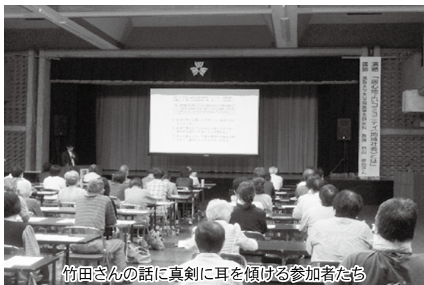
竹田さんの話真剣に耳を傾ける参加者たち

参加者からは、「できることから始めてみたい」「安心して自分の弱さを出せて、支えられる地域づくりは大切だと思う」などの感想が寄せられました。