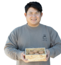
湯梨浜産温泉たまごのクロックマダムと 鬼蜷のスープのセット