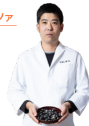
鬼蜷と湯梨浜産たまごの玉締め