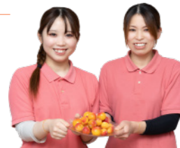
湯梨浜産 野花梅のゆるスイーツ