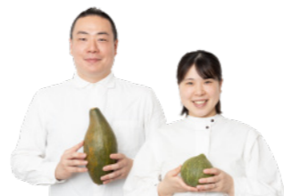
湯梨浜産野菜の濃厚ポタージュセット