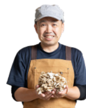
湯梨浜産 水溫熟成舞茸のカリー