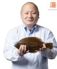
湯梨浜ひらめの贅沢丼