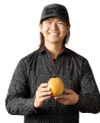
和牛のBBQ 湯梨浜産梨の メキシカンソース