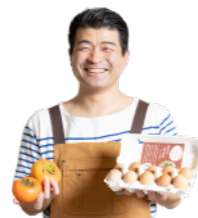
湯梨浜産フルーツグラタンピッツァ