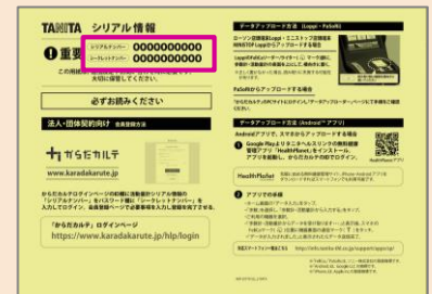
黄色い紙（活動量計の箱に同梱）