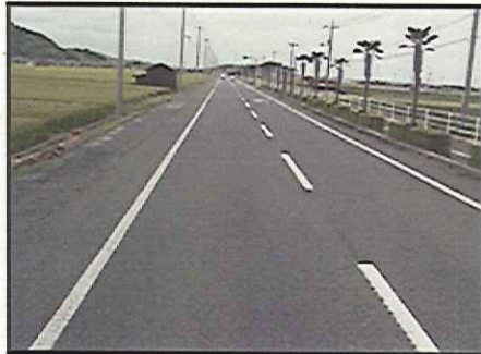
<対策メニュー> 歩道設置(L=900m)【鳥取県】

・当区間の歩道幅員が狭いため、現在集落内の道路を通学路として利用しているが、現通学路は幅員が狭く危険。