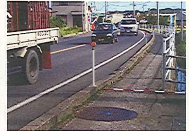
<対策メニュー> 歩道拡幅(L=400m)【鳥取県】

・当区間の歩道幅員が狭いため、現在集落内の道路を通学路として利用しているが、現通学路は幅員が狭く危険。