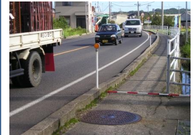
<対策メニュー> 歩道拡幅(L=400m)【鳥取県】

・当区間の歩道幅員が狭いため、現在集落内の道路を通学路として利用しているが、現通学路は幅員が狭く危険。