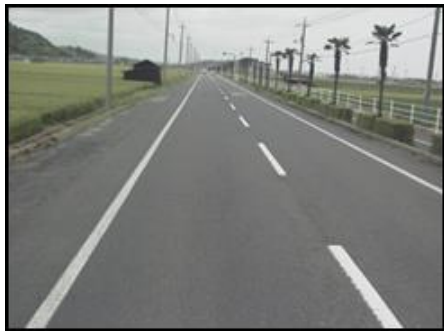
<対策メニュー> 歩道設置(L=900m)【鳥取県】