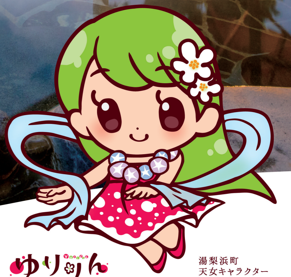
はわい温泉・東郷温泉