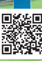
グラウンド・ゴルフの里 潮風の丘・とまり