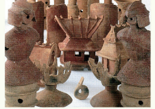
国指定重要文化財 長瀬高浜遺跡出土埴輪

所 湯梨浜町野花 MAP29 ☎ 0858-35-5367(湯梨浜町教育委員会 生涯学習・人権推進課)