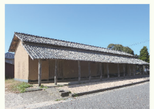
県指定保護文化財 橋津藩倉

所 湯梨浜町橋津 MAP31 ☎ 0858-35-5367(湯梨浜町教育委員会 生涯学習・人権推進課)