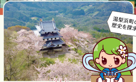
湯梨浜町の歴史を探索! 湯梨浜町の歴史を探索! 県指定史跡 羽衣石城跡

所 湯梨浜町はわい長瀬 MAP30 ☎ 0858-35-5367(湯梨浜町教育委員会 生涯学習・人権推進課)