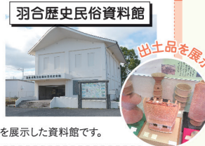
湯梨浜町の文化財や歴史を展示した資料館です。 湯梨浜町歴史民俗資料館

所 (泊)湯梨浜町泊1204-1 MAP34 (羽合)湯梨浜町久留19-1 MAP35 ☎ 0858-35-5367(湯梨浜町教育委員会 生涯学習・人権推進課) 9:00~16:30 大人100円、小・中学生50円 休 12月29日~1月3日