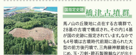
国指定史跡 橋津古墳群

標高372mの羽衣石山にあり、その昔この辺りを拠点としていた南条氏の居城がありました。本丸や虎口、曲輪など城の遺構が確認されており、現在は模擬天守が再建されています。