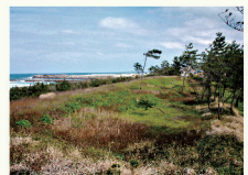
国指定史跡 鳥取藩橋津台場跡

所 湯梨浜町羽衣石 MAP27 ☎ 0858-35-5367(湯梨浜町教育委員会 生涯学習・人権推進課)