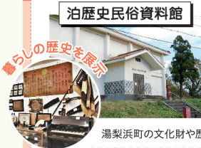
湯梨浜町の文化財や歴史を展示した資料館です。 湯梨浜町歴史民俗資料館